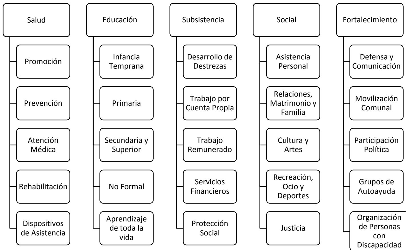
Fig. 2: Matriz de RBC en las Guías (OMS, 2012)