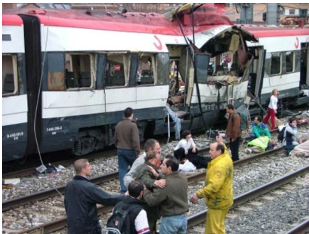
Terrorismo en Egipto