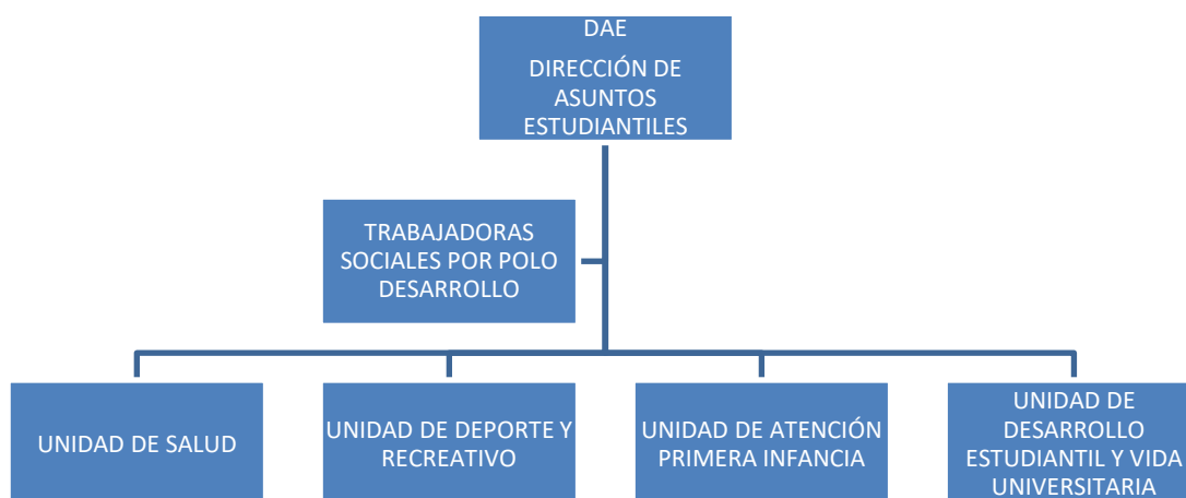
Figura 1. Organigrama Funcional DAE 2020