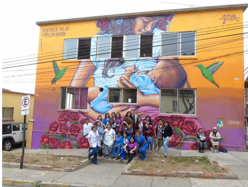
Fotografía N°2: Dependencias del Cesfam