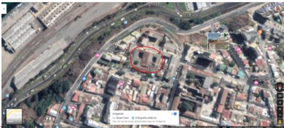
Fotografía N°3: Vista aérea Ex Comisaria Barón

Siguiendo el eje anterior, encontramos que CESFAM Barón cuenta con un fuerte trabajo de redes con diversas organizaciones territoriales, vecinales como la JJVV N°56 Juan Liona y el Pilar, JJVV N°53 Los Lecheros, Club de adulto mayor “Esperanza de Vida”; Culturales como el Parque Escuela 336 e Instituciones del territorio como la ONG Mirador y el PPF Ghandi 4 comprendido desde Cerro Polanco hasta Rodelillo lo que ha brindado la oportunidad de conocer y vincularse directamente con las necesidades del territorio y su comunidad. En este último contexto, es que CESFAM Barón a través del área de promoción, se relaciona directamente con diversas organizaciones territoriales que mantienen un profundo interés por un inmueble ubicado en las proximidades de la Iglesia San Francisco y con el cual se proyectaban a trabajar directamente con la Institución.