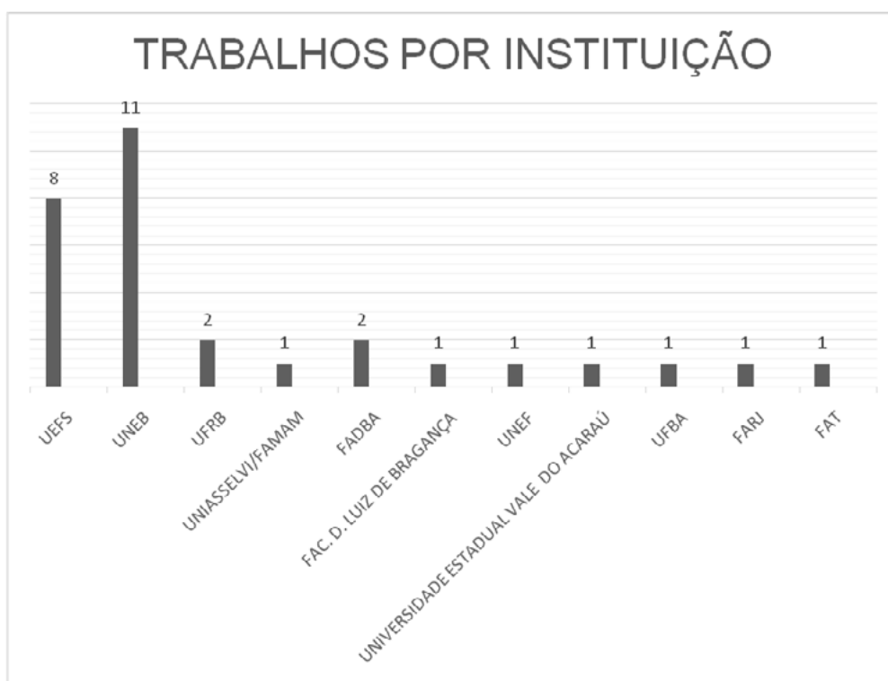
Gráfico 1 – Distribuição dos trabalhos por instituição